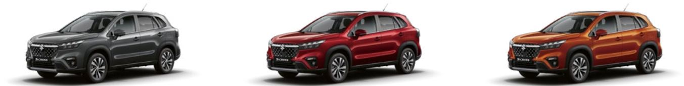
Titan Dark Gray Pearl Metallic

Sie wollen die Ausstattungsdetails im Einzelnen sehen? Einfach QR-Code anklicken.