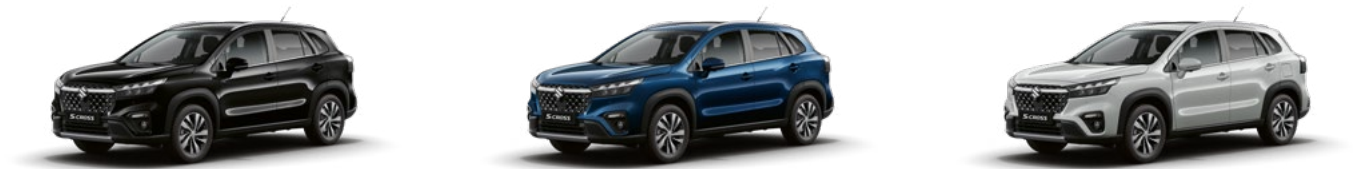
Cosmic Black Pearl Metallic