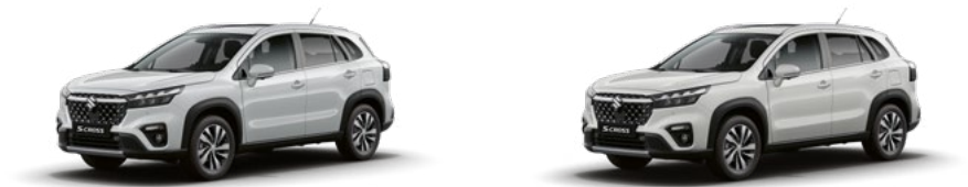
Cool White Pearl Metallic